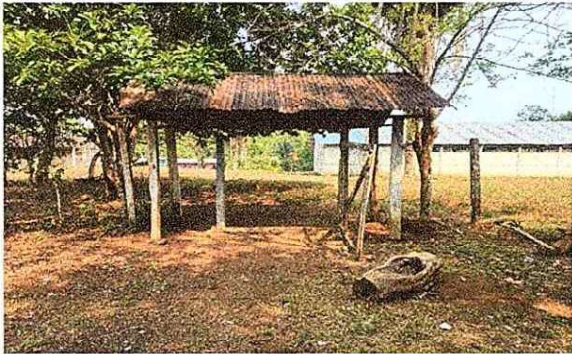
Foto 1: Instalacion de porton de acceso principal al establecimiento