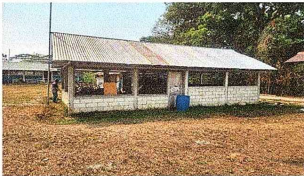
Foto 3: Mejoramiento de las instalaciones de la cocina del establecimiento