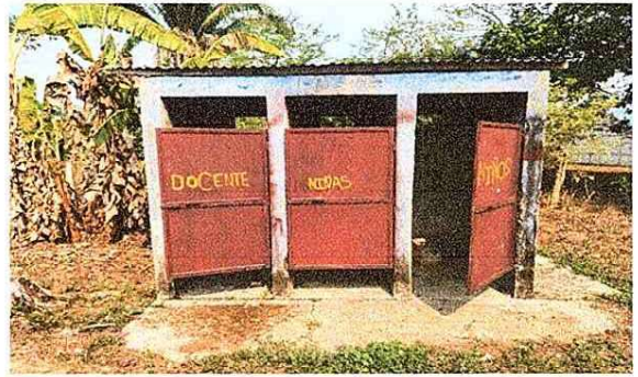
Foto 2: sustitucion de estructura y cubierta, cambio de puertas en malas condiciones